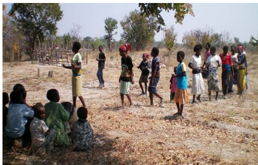
Enfants participants à une animations anti-sida

Dans les unités de Mansa et Chibombo des ateliers d'éducation par les pairs ont été mis en place. L'objectif est de laisser les enfants prendre en charge eux mêmes la sensibilisation de leurs pairs. Ces ateliers les aident à partager leurs expériences de la maladie, qu'ils soient infectés ou non. Ces ateliers leur permettent de libérer la parole, de dédramatiser certaines situations et surtout de mettre un frein à la discrimination. Les plus jeunes prennent alors conscience que la séropositivité n'est ni une tare ni une fatalité et que la vie reste possible si les malades sont pris en charge.