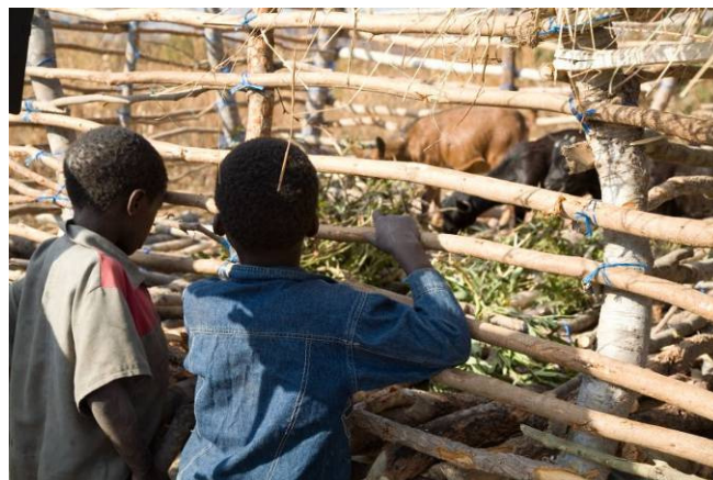
Le bétail nouvellement distribué

✓ 76 familles parmi les plus défavorisées ont reçu du bétail pour permettre la mise en place d'activités d'élevage.