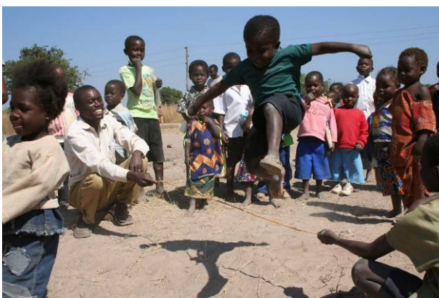
Enfants lors d'une activité organisée par des aides soignants

✓ 2 groupes de soignants ont suivi une formation pour pouvoir répondre aux besoins psychosociaux des enfants touchés de façon directe ou indirecte par le VIH/Sida.